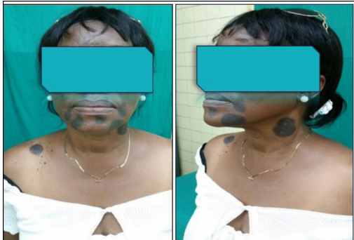
Fig. 1 y 2. Lesiones cutáneas de localización peribucal, labios, mentón, plano lateral izquierdo del cuello y área supraclavicular derecha, placas infiltradas, redondeadas, de color negro, con ampollas y costras en su superficie

no dolorosas a la palpación y superficie suave e irregular, estas lesiones no están relacionadas al cuadro cutáneo en cuestión, figuras 1 y 2.