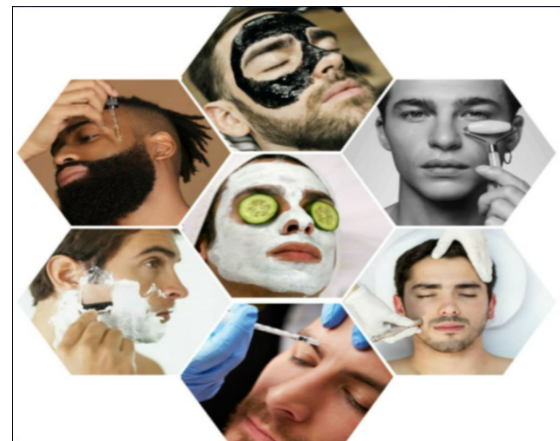
Fig. 1. Técnicas cosméticas practicadas por el hombre

En la actualidad, es evidente la extensa gama de productos exclusivos masculinos, destinados al cuidado de la piel y el cabello del hombre, que incluye desde los productos de higiene básica, hasta los más sofisticados y atrevidos productos de belleza y de tratamiento estético, figuras 1 y 2.